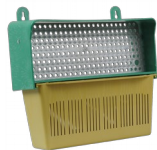
Poławiacz pyłku – 205mm