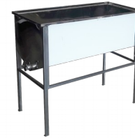
Wzmacniany stół do odsklepiania - 1m (Stal kwasoodporna/0,8mm)

stal nierdzewna (kwasoodporna) grubość blachy: 0,8 mm wymiary korpusu: 1020X500mm zawór: nierdzewny 6/4 nogi: malowane proszkowo zakres regulacji wysokości 620-980mm stół przystosowany do ramek o szerokości 435mm gwarancja: 2 lata