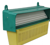
Poławiacz pyłku – 310mm

KOD: A1046 CENA NETTO: 17,07 PLN CENA BRUTTO: 21 PLN