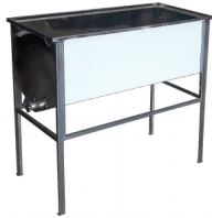
Stół do odsklepiania - 1m (Stal kwasoodporna/0,6mm)

stal nierdzewna (kwasoodporna) grubość blachy: 0,6 mm wymiary korpusu: 1020X500mm zawór: nierdzewny 6/4 nogi: malowane proszkowo zakres regulacji wysokości 620-980mm stół przystosowany do ramek o szerokości 435mm gwarancja: 2 lata