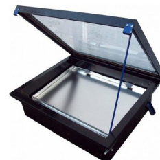
Topiarka słoneczna do wosku

KOD: U1012 CENA NETTO: 796,75 PLN CENA BRUTTO: 980 PLN