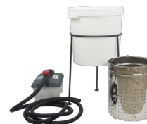
Topiarka do wosku z wytwornicą pary

KOD: U1027 CENA NETTO: 536,59 PLN CENA BRUTTO: 660 PLN