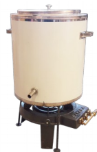
Topiarka parowa ( nierdzewna) z taboretom gazowym i stojakiem

KOD: U1006 CENA NETTO: 439,02 PLN CENA BRUTTO: 540 PLN