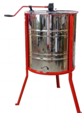
Miodarka 2-kasetowa z napędem ręcznym

stal nierdzewna (kwasodporna) grubość blachy: 0,6 mm średnica: 525 mm napęd: ręczny zawór: nierdzewny 6/4 wymiary kasety: 310x420x50 mm nogi: malowane proszkowo pokrywa: pleksa 3 mm gwarancja: 2 lata