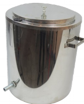
Topiarka parowa do wosku 17L (nierdzewna)

stal nierdzewna (kwasodporna) grubość blachy: 0,6 mm średnica: 367 mm pojemność kosza: 17L waga: 5,7kg wymiary: 470x440 mm przybliżony uzysk wosku: 1,2 kg gwarancja: 2 lata