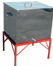
Topiarka parowa do wosku (13/19 ramek Dadant/Wielkopolska)

KOD: U1024 CENA NETTO: 634,15 PLN CENA BRUTTO: 780 PLN