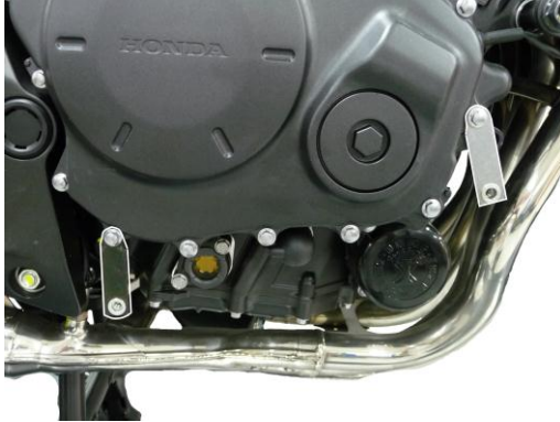
Fitting brackets on the right