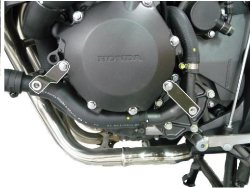
Fitting brackets on the left