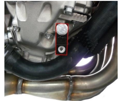
Patte côté droit