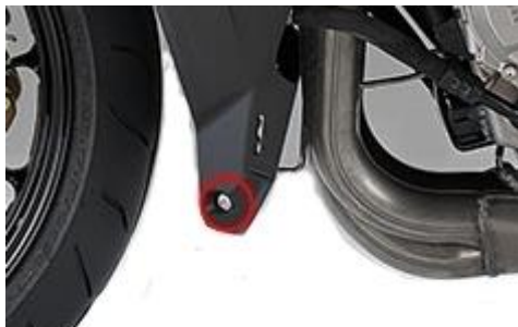
Original fixing to remove