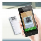
Zeskanuj kod QR

Uwaga: Do poprawnego działania czujnika niezbędne jest dokupienie odbiornika TFA 31.4000