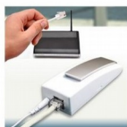
Podłącz do routera