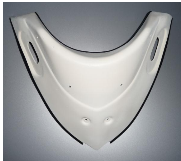
Rubber seal location