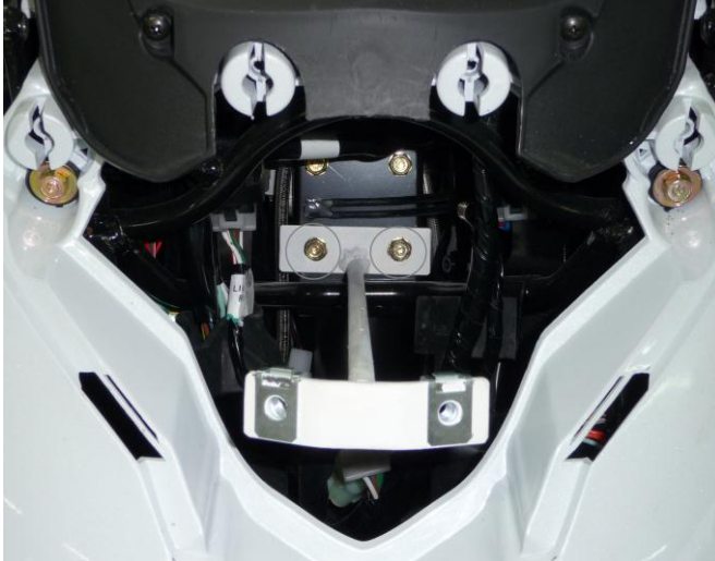
Position de la patte de fixation